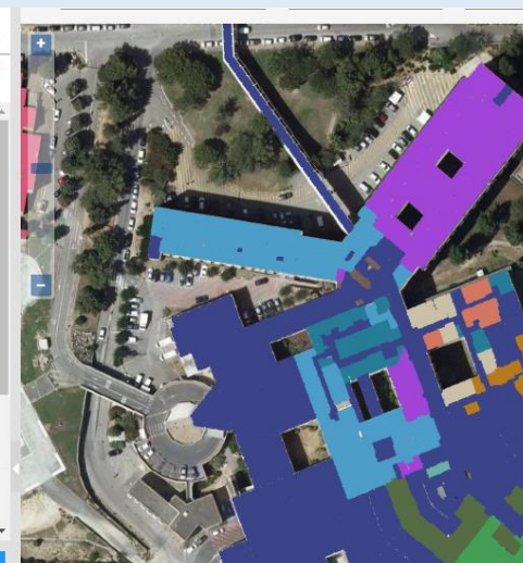
Plans colorisés par pôles Image 1